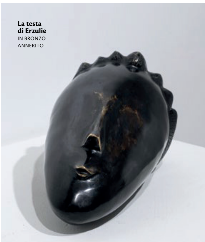
La testa di Erzulie IN BRONZO ANNERITO

«Immagino il mio lavoro come un libro dove sculture, installazioni, video dialogano nei vari capitoli»